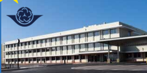
↑校章は、糸島の象徴「糸島銅鏡」と糸島を代表する「ハマボウの花」をモチーフに作成。

これまで県立の特別支援学校がなかった糸島市に、福岡県立糸島特別支援学校を開校し、4月27日には開校記念式典を開催しました。