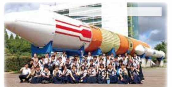
「関東修学旅行」におけるJAXA研修

机上の勉強では得られない深い学びを後輩の皆さんもぜひ経験してほしいです。(高校生徒)