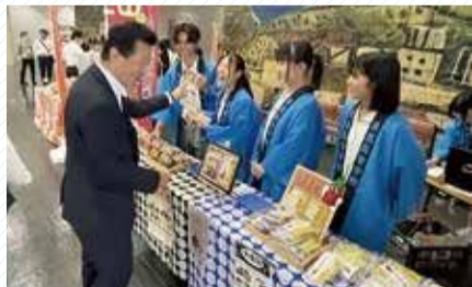
6月物産展 参加高校・商品(一部)