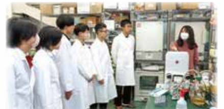
「関東修学旅行」における東京大学での講義