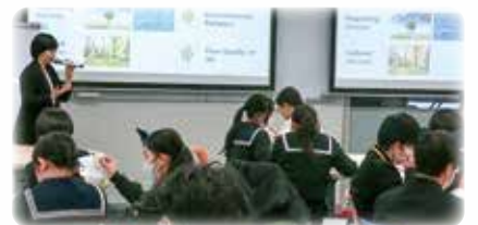
九州工業大学における校外学習

中・高6年間の探究活動で地域の抱える問題等の調査研究・考察を行うことから始め、地域から世界へ視点を広げた、社会に貢献できる人材の育成を図ります。