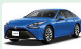
自動車は走る半導体と呼ばれ、1台に約数十個から100個程の半導体が使われています