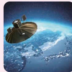
福岡県の宇宙ベンチャー （株）QPS研究所が開発した 超小型レーダー衛星

福岡県には、宇宙に挑戦する企業や、宇宙に関する研究を行っている九州大学、九州工業大学などがあります。このような企業、大学といっしょに、人工衛星やロケット、人工衛星からのデータを活用した新しいサービスの開発、宇宙食の開発などに取り組んでおり、宇宙ビジネス振興の取り組みに熱心な県として、国から「宇宙ビジネス創出推進自治体」に選ばれています。