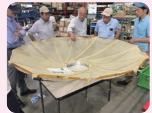
衛星の開発には県内のたくさんの ものづくり企業が関わっています