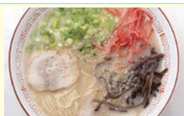
とんこつラーメン

ストレートタイプの細麺と、豚骨のこくとうま味が凝縮されたコラーゲンたっぷりのスープが特徴。お好みで「白ごま」「紅ショウガ」「高菜」などと一緒に食べるのもおすすめです。