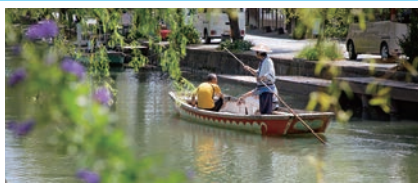
⑥柳川川下り(柳川市)

直方駅~行橋駅間を車窓に流れるのどかな風景を眺めながら、贅を尽くした列車空間と共に地産地消にこだわった絶品フレンチコースを堪能できます。車両デザインは、JR九州の「ななつ星」や「或る列車」を手掛ける水戸岡鋭治氏です。