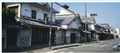
⑦筑後吉井白壁の町並み(うきは市)

江戸時代に城下町として栄えた柳川は「水郷(水のまち)」としても知られる観光名所です。水路「掘割」を巡る川下りでは、しだれ柳や季節の花々、白壁の美しい街並みを水面から眺める贅沢な時間が過ごせます。