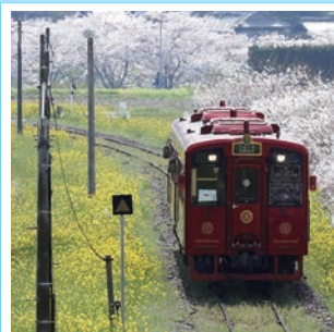
⑤ことごと列車(平成筑豊鉄道)

直方駅~行橋駅間を車窓に流れるのどかな風景を眺めながら、贅を尽くした列車空間と共に地産地消にこだわった絶品フレンチコースを堪能できます。車両デザインは、JR九州の「ななつ星」や「或る列車」を手掛ける水戸岡鋭治氏です。