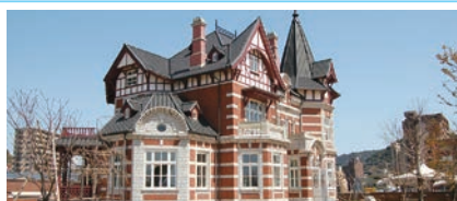
②門司港レトロ地区(北九州市)

糸島市北部に位置する県の名勝地で夕日美しいことから「夕日の二見ヶ浦」と呼ばれています。寄り添って夫婦のように並ぶ巨大な岩「夫婦岩」も有名です。周辺にはおしゃれなカフェやレストランが並び、たくさんの観光客が訪れます。