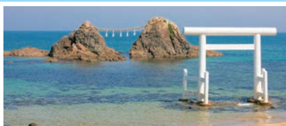
①桜井二見ヶ浦・夫婦岩(糸島市)

糸島市北部に位置する県の名勝地で夕日美しいことから「夕日の二見ヶ浦」と呼ばれています。寄り添って夫婦のように並ぶ巨大な岩「夫婦岩」も有名です。周辺にはおしゃれなカフェやレストランが並び、たくさんの観光客が訪れます。