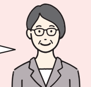
更生保護女性会員

たとえば、地域の人たちに更生保護の心を伝えるミニ集会や、子育てに悩むお母さんたちを集めての子育て支援教室、地域の子どもたちと一緒に非行防止活動といった活動もありますよ。