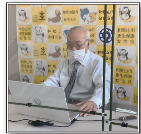
幸福の黄色いバックパネル

また、パソコンを操作することができる保護司に教わりながら、オンライン会議を行うようになりました。最初は分からないことだらけでしたが、最近は少しずつ慣れてきました。やればできるものです。画面越しの相手にわかりやすいよう、保護司会・更生保護女性会・BBS 会の名前が入った“幸福の黄色いバックパネル”を作成したり、みんなで知恵を出し合いながら頑張っています。