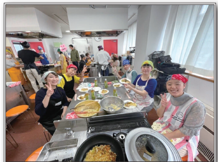
グループワークの一環でお好み焼き作りをする様子

A ともだち活動はもちろんですが、グループワークと自己研鑽に注力しています。ここ数年のグループワークでは、バーベキュー、横浜の街散策、ビーチボールバレー、お好み焼き作りを実施しました。グループワークに少年が参加してくれたことがきっかけで、ともだち活動が始まったケースもあり、継続的に少年と関わる機会を作り続けることが重要だと考えています。ともだち活動は、年間数名の少年を途切れることなく担当しており、毎月開催している定例会の中で進捗を報告し、会員や保護司の方から様々な角度でアドバイスをもらい、定例会が研鑽活動の場にもなっています。また、新たな活動として、神奈川県内の児童家庭支援センターへの訪問活動を開始し、地域に根ざした活動も行っています。