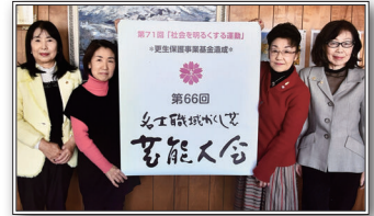
名士職域かくし芸芸能大会にて

A 毎年、“社会を明るくする運動”の一環として、当会主催で「名士職域かくし芸芸能大会」を実施しています。当日は、子供たちのミュージカルや日本太鼓演奏等の出し物で大いに賑わいます。保護観察所、保護司会、BBS会を始め、市内の多くの団体の御協力の下、開催することができ、人と人が繋がることの大切さを再認識することができる活動です。