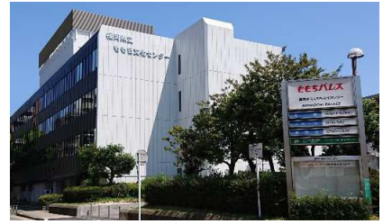
(写真: 福岡県立ももち文化センター全景)