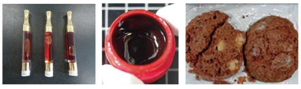
大麻リキッド 大麻ワックス 大麻クッキー

「大麻リキッド」「大麻ワックス」など大麻から幻覚成分を抽出・濃縮した加工品が摘発されています。また海外旅行のお土産としてもらったものでも違法です。