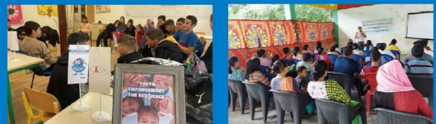
モンテネグロ：若者の参加によるワークショップ インド：家族対象の薬物乱用防止研修