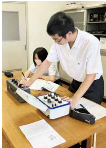
【寄贈品】ホイトストーンブリッジ

寄贈いただいた実習器具は、早速、実習や課題研究等で活用しています。 「株式会社エルテックス・ヨシダ」様、ありがとうございました！