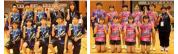
中間東中 卓球男子団体3位 卓球女子団体3位