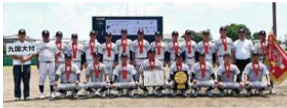
全国高等学校野球選手権福岡大会優勝 九州国際大学付属高校