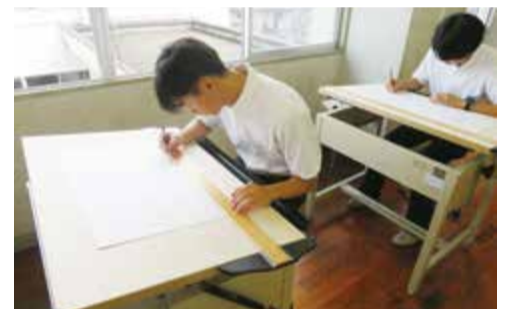
【寄贈品】ベニア製図板