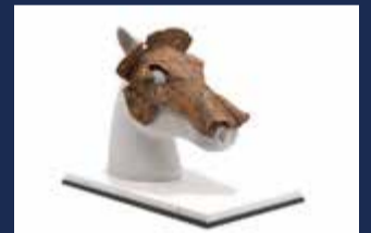
古賀市船原古墳出土馬冑

期間 10月7日(土)～12月3日(日) 休館日 月曜日(祝休日の場合はその翌平日) 場所 九州歴史資料館 第1・2展示室 観覧料 一般:210円 高大生:150円 小中生:無料 ※毎週土曜日は高校生無料