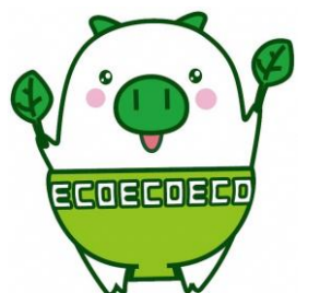
福岡県マスコットキャラクター 「エコトン」

福岡銀行、西日本シティ銀行、筑邦銀行、福岡中央銀行、佐賀銀行、北九州銀行、十八親和銀行、熊本銀行、佐賀共栄銀行、西京銀行、豊和銀行、三菱UFJ銀行、三井住友銀行、福岡信用金庫、福岡ひびき信用金庫、大牟田柳川信用金庫、筑後信用金庫、飯塚信用金庫、田川信用金庫、大川信用金庫、遠賀信用金庫、福岡県信用組合、横浜幸銀信用組合、商工組合中央金庫（以上24金融機関）