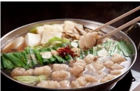
<博多金もつジパング・もつ鍋>