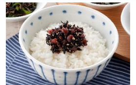
<太宰府えとや・梅の実ひじき>