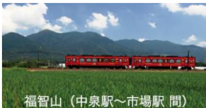
福智山（中泉駅～市場駅間）

福智山（中泉駅～市場駅間） 標高901mのまちのシンボルで九州百名山として登山家にも人気。