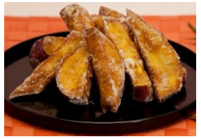
<さかえや・ソフトかりんとう>