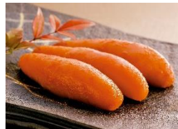
<ふくや・辛子明太子>