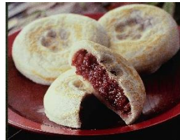
<かさの家・梅ヶ枝餅>