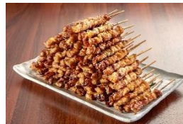
<とりかわ竹乃屋・とり皮>