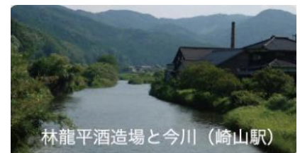
林龍平酒造場と今川（崎山駅）

香春岳（勾金駅） 映画やドラマ化された小説の舞台にもなった山。一の岳、二の岳、三の岳からなり、一の岳は石灰採掘によって元の半分程度まで削られている。