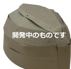
②沖ノ島ポップアップカード