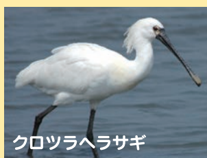
クロツラヘラサギ

生きものたちを守るために、まず、福岡県にどのような生きものがすんでいるのかを知ることが大切なんだよ。