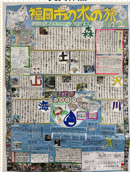
【ぶらぶらあぶらクラブ「福岡市の水の旅」】