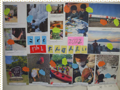
【子どもnhkたんけんたい】