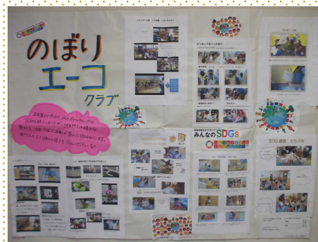
【のぼりエコークラブ】