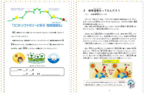
地球温暖化対策ワークブック(小学校5・6年生用)

学校の授業での活用のほか、家庭での長期休みの課題、調べ学習やグループワークにも活用できる教材です。県ホームページに掲載していますので、ダウンロードしてご活用ください。