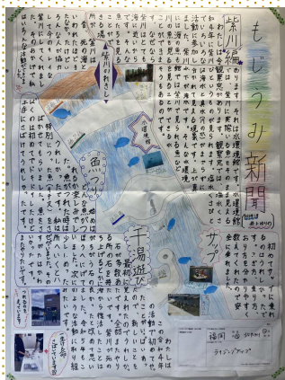
【ライジングアップ】