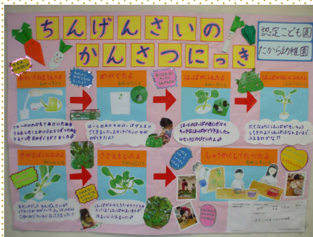
【学校法人たから学園 認定こども園たから幼稚園】