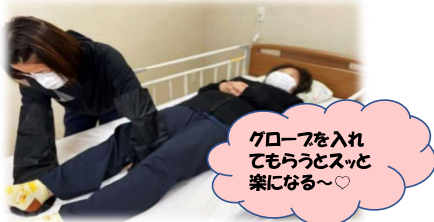
スライディンググローブ