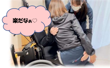
スライディングボード