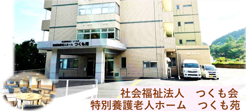
社会福祉法人 つくも会 特別養護老人ホーム つくも苑