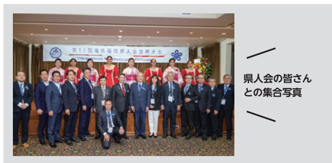
県人会の皆さんとの集合写真

11月16日～18日、「第11回海外福岡県人会世界大会」がペルー・リマで開催されました。知事、県議会議長をはじめとする訪問団は、移住者らが結成した県と各地を繋ぐ懸け橋である海外県人会の皆さんと交流し、関係を深めました。