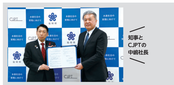
知事とCJPTの中嶋社長

12月26日、県はFCV(水素燃料電池車)をはじめとする商用の次世代電動車の普及に取り組むCJPT(トヨタ自動車などが出資する合併会社)と連携協定を締結しました。この協定の下、水素を燃料とするトラックや乗用車の普及を促進していきます。