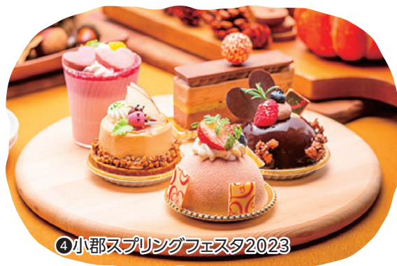
④小郡スプリングフェスタ2023