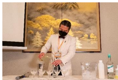
（写真 2）カクテルの実演