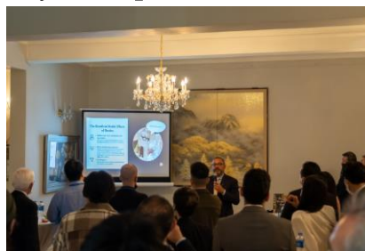
（写真 1）焼酎・泡盛についての講義を聴く参加者

日本ではロックや水割り、お湯割りといった飲み方で食事中に焼酎・泡盛を楽しむことが多いが、食中酒があまり一般的ではない香港では、カクテルという形が焼酎・泡盛の間口を広げる有力なアプローチとなることから、分科会としては、今後もバーテンダーを対象とした PR や焼酎・泡盛を使ったカクテルの PR を継続していきたいと考えている。