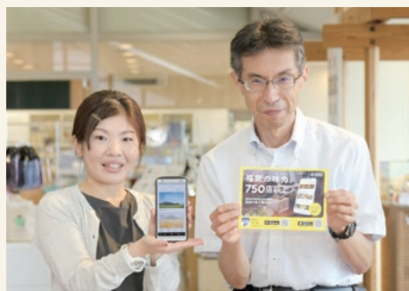
アプリの魅力をPRする担当者

アプリでは、福岡の魚や酒を提供する「応援の店」をエリアや料理ジャンル、店名から簡単に検索でき、対象のお店で使えるお得なクーポン※も配信しています。また、「著名人の愛する酒」や「自宅レシピ」、「店主自慢のペアリング」など、耳寄り情報の特集記事として定期的に配信中。