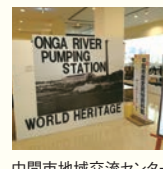
中間地域交流センター 【住所】中間市大字垣生 660-1