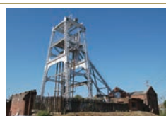
三池炭鉱 宮原坑 重工業の燃料となる石炭を産出し、日本の近代化を支えた主力炭鉱