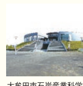
大牟田市石炭産業科学館 【住所】大牟田市岬町 6-23