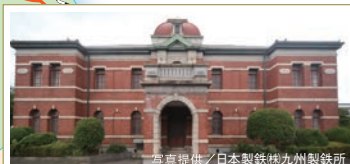
官営八幡製鐵所 旧本事務所 1899年に建てられ、製鐵所の中心的な役割を果たした初代本事務所

※官営八幡製鐵所旧本事務所、遠賀川水源ポンプ室は非公開施設です。眺望スペースから施設の外観を見学することができます。