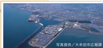
三池港 三池炭鉱で産出された石炭を運び出すためにつられ、現在も産業港として使われている