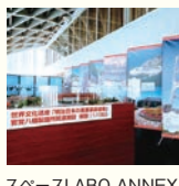
スペースLABO ANNEX 【住所】北九州市八幡東区 東田2-2-11