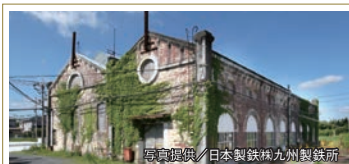
遠賀川水源ポンプ室 1910年以来、現在も動き続けている製鐵所の送水施設