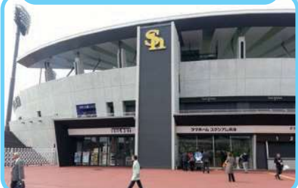
HAWKSベースボールパーク筑後

ソフトバンクホークスの2・3軍の本拠地。観戦のあとは船小屋温泉でゆっくりひと息できるよ。