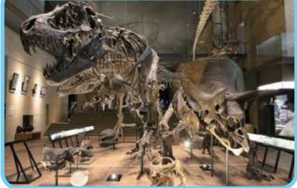
いのちのたび博物館

福岡県の各地域には、魅力ある観光資源がたくさんあります。みんなも福岡県のいいところをどんどんアピールしていきましょう。