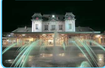
門司港レトロ地区