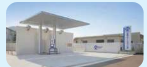
水素ステーション