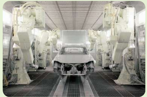
福岡県製造品出荷額など(令和元年)