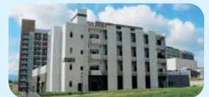
九州大学 水素材料先端科学研究センター