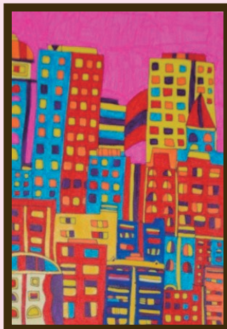
「キレイな外国の街」作者:立野 淳也 たての じゅんや 蛍光色を用いたビビッドな色彩が目を引き作品。夢の国にいるような楽しさを感じる。