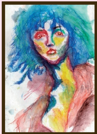
「リリー・コール」作者:柳田 烈伸 やなぎた たけのぶ 体の震えを生かして描かれている。哀愁のある眼差しと色使いが魅力的な作品。