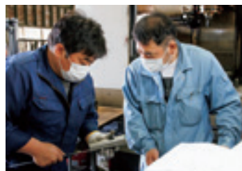
▲ 機械の操作には、熟練の職人の知識が欠かせない。