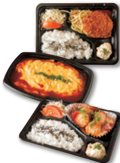
▲メンチカツ弁当(上/594円) オムライス弁当(中/594円) ホタテのソテー弁当(下/972円)。