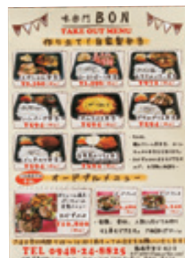
▲テイクアウト専用で作ったメニュー表。