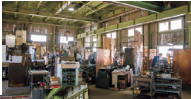
▲ 最新のマシニングセンタ。

独自の技術を守りながら、地域のニーズにくまなく対応できる会社でありたいと考えています。一昨年秋に亡くなった父は、一代で会社を築き上げた職人でした。父の夢だった「加工から組み立てまでできる工場」を、いつか実現したいと思っています。