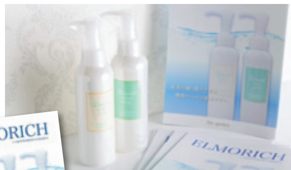
▲ オリジナル化粧品「エルモリッチ SC」クレンジング(右)とウォッシング(左)

持続化補助金、経営革新実行支援補助金の申請支援を主に実施し、経営発達支援計画に基づく伴走型支援で策定を実施しています。明るい雰囲気と前向きな経営姿勢で、支援させていただいたこちらにも元気を分けていただいた事業所様です。今後も田川の地で美を求める消費者のために、積極的な事業展開を図られることを応援しています。