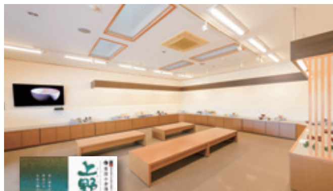
▲ ギャラリーを新たに新設。

当会員には高齢者が多く、SNS活用など困難な窯元が多くいらっしゃいます。組合でネットショップ運営に力を入れ、上野焼全体の活性化と福智町の観光に繋げていけるよう、取組んでいきます。