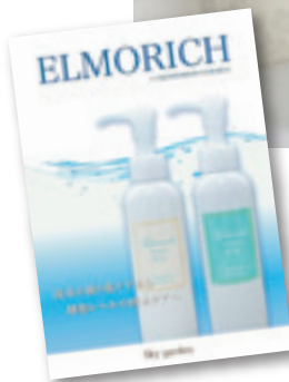
▲ 商品パンフレットも制作。