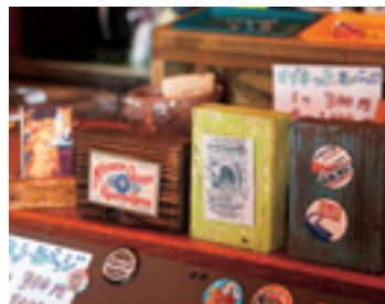
▲ バッジを飾れる「ウッドブロック」も人気アイテムのひとつ。