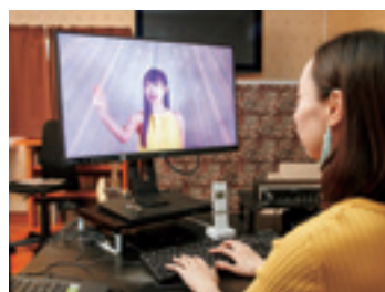
▲ レコーディング・撮影後に編集作業。