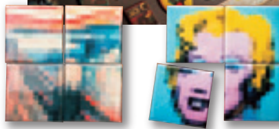
▲ 個性的なパズルアート(4枚1,000円)。