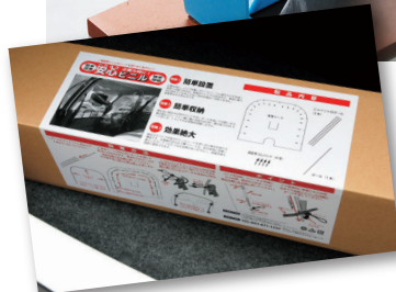
▲ コンパクトに収納、設置方法付き。