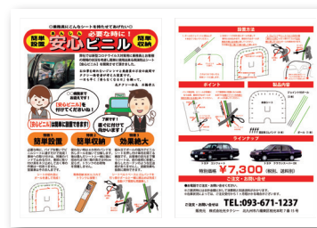
▲ 販促として郵送するチラシも作成。