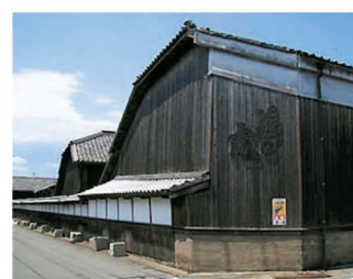
酒どころ城島の町並み