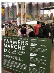
「農業」と「福祉」の連携で生まれた農産物等を販売する「農福連携マルシェ」