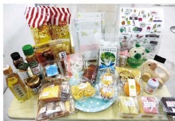
まごころ製品の一例

1年間に10万円以上の「まごころ製品」を購入した企業等を「障がい者応援まごころ企業」として認定