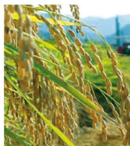
県内で多く栽培される「山田錦」

県内に約70ある酒蔵では、これらの県産酒米を使用した日本酒に加え、麦焼酎を中心とした多種多様な焼酎が醸されています。