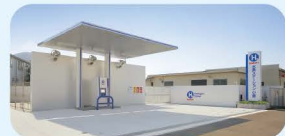
水素ステーション