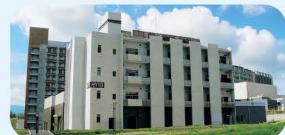
九州大学 水素材料先端科学研究センター

また、FCVの普及に向けて、FCVに水素を供給する水素ステーションの整備も進めています。県庁敷地内に設置している水素ステーションを含めて、現在、県内11か所に水素ステーションが設置されています。