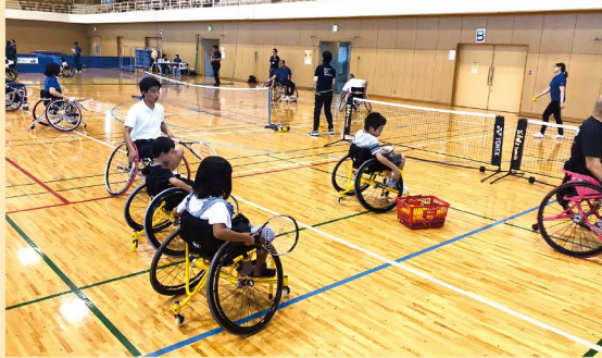
パラスポーツ体験イベント