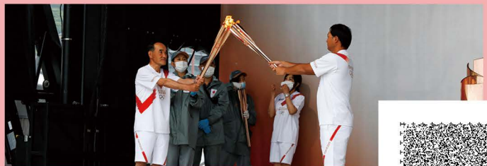
5月12日北九州市での点火セレモニー(トーチキス)