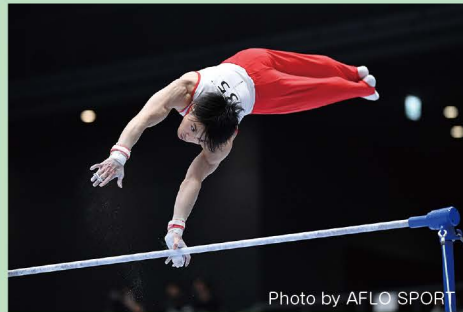
上:体操競技(鉄棒)の様子 右:新体操(リボン)の様子