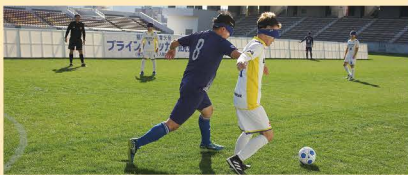
福岡県民スポーツ大会（障がい者の部）ブラインドサッカー競技