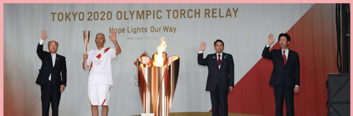
5月11日福岡市での点火セレモニー(フォトセッション)

この聖火が希望の火として、日本の人々を、世界の人々を照らしてくれることを願い、次の山口県へと引き継がれたよ。