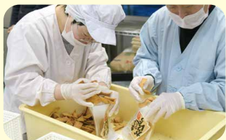
チームワークが第一！気の合う仲間たちと分担制で作業を進める

25年前、お豆腐屋さんのおいしいおから入りのかりんとうを作ったところ、口コミで人気がありました。今では、かりんとう4種類、ラスク8種類の商品を毎日、仲間と一緒に楽しく作っています。生地をこねるところや黒糖をコーティングするところが重要なので、うまくできてお店の人から「売れました」と言われるとうれしくなります。ウェブサイトや店頭で見かけたら、ぜひ食べてみてくださいね！