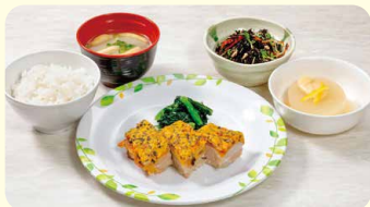
はかた地どりの黄金焼き