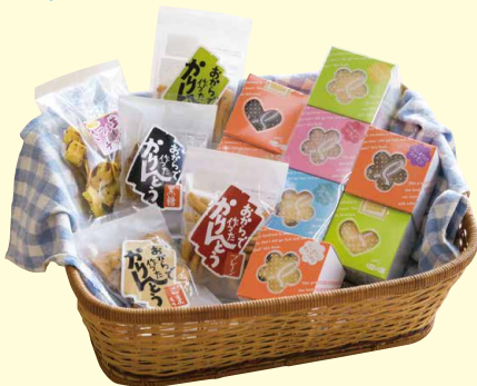
人気の「おからで作ったかりんとう」や「ラスク」などの手作り商品