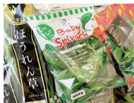
生産者：(有)コスモファーム