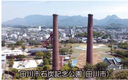
田川市石炭記念公園(田川市)