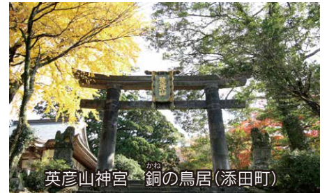
英彦山神宮 銅の鳥居(添田町)