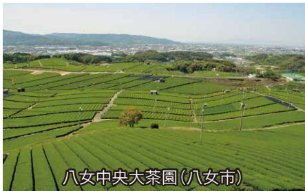
八女中央大茶園(八女市)