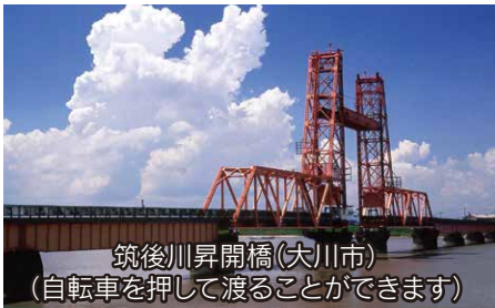
筑後川昇開橋(大川市) (自転車を押して渡ることができます)