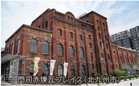
門司赤煉瓦ブレイス(北九州市)