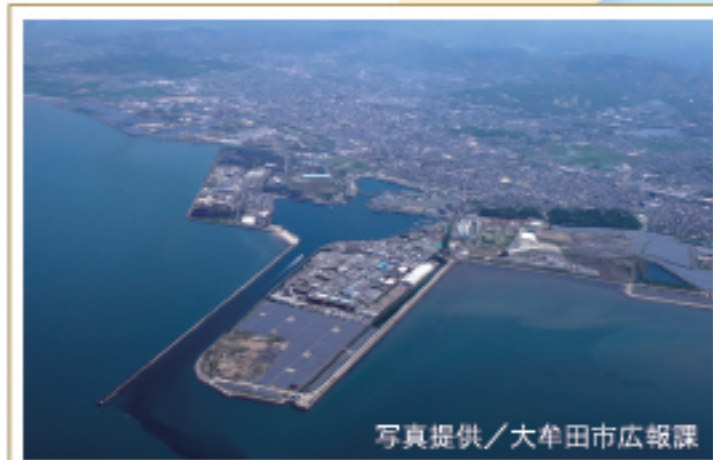
三池炭坑で産出された石炭を運び出すため につくられ、現在も産業港として使われている

※官営八幡製鐵所 旧本事務所、遠賀川 水源地ポンプ室は非公開施設です。 眺望スペースから施設の外観を見学 することができます。