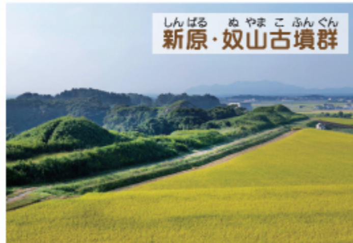
行くことのできない沖ノ島を、はるか遠くか ら拝むための場所