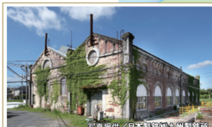
1910年以来、現在も動き続けている製 鐵所の送水施設