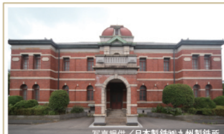
1899年に建てられ、製鐵所の中心的な 役割を果たした初代本事務所