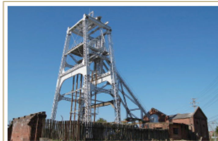
重工業の燃料となる石炭を産出し、日本 の近代化を支えた主力炭坑