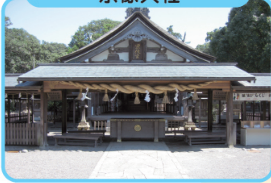
むなかたたいしゃ 宗像大社