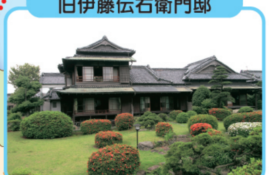
きゅういとう だんえもんてい 旧伊藤伝右衛門邸