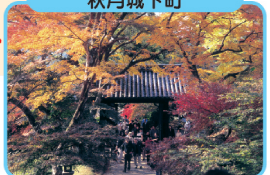
あきづきじょうかまち 秋月城下町