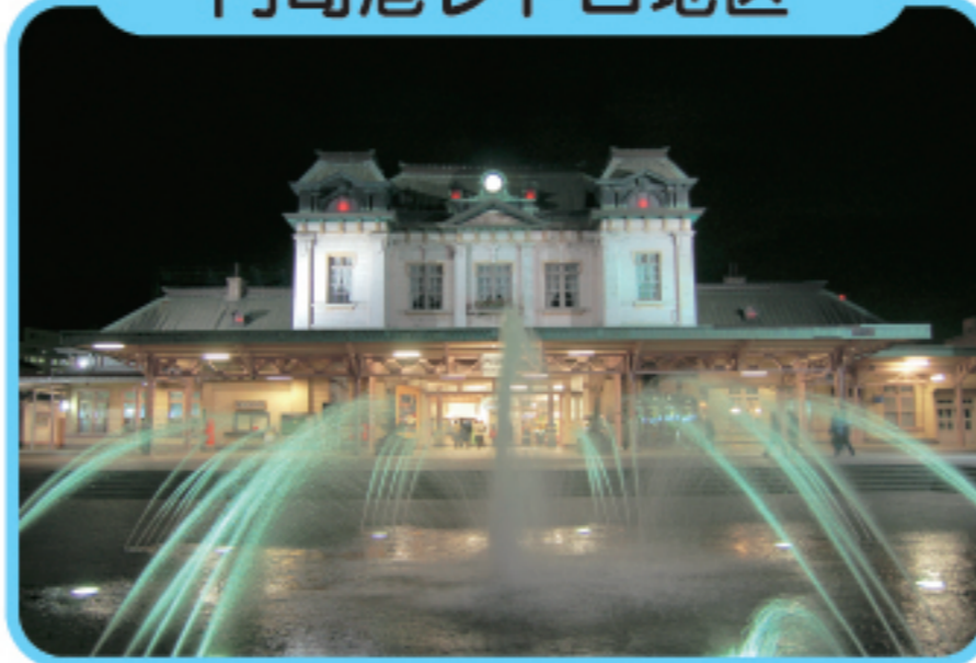
もじこう ちく 門司港レトロ地区