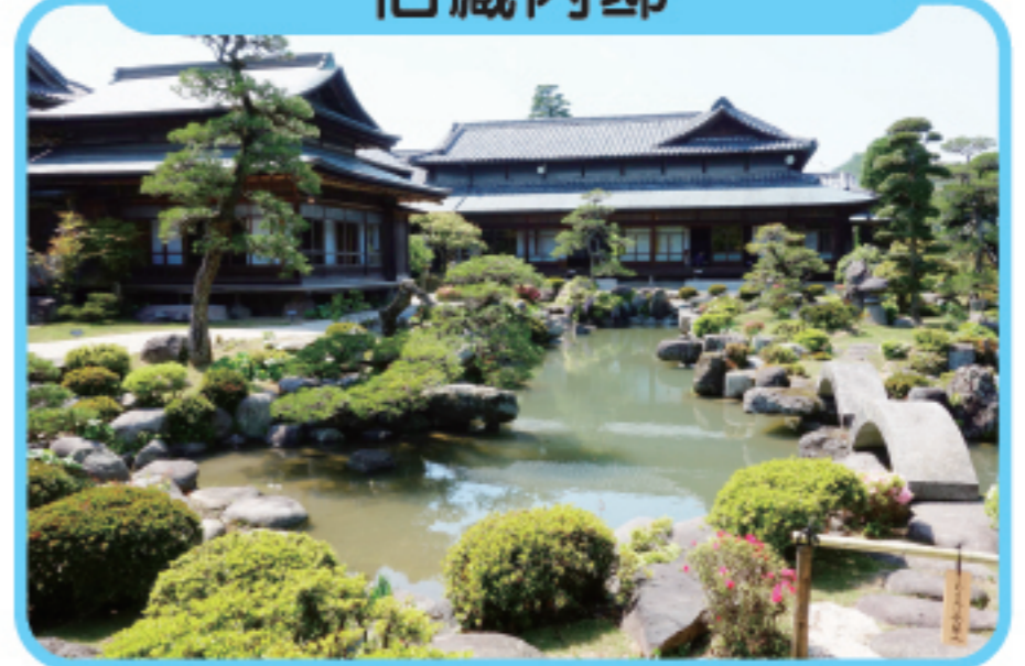
きゅうくらうち 旧藏内邸