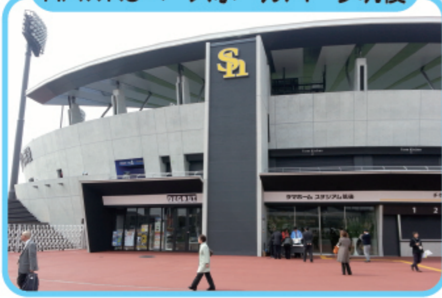
ホークス ちくご HAWKSベースボールパーク筑後

ソフトバンクホークスの2・3軍の本拠地。観戦のあとは船小屋温泉でゆっくりひと息できるよ。