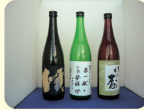
福岡オリジナル吟醸酒

福岡県では、生物の持つ能力や性質をいかす「バイオ技術」を活用して、産業を振興しています。 久留米市など筑後地域は、昔から醤油や味噌など発酵食品の製造が盛んであり、また日本酒を造る酒蔵もたくさんあります。この地域を中心に新しい薬や健康食品、福岡県独自のお酒などの製品ができたり、バイオに関係する企業が新しく設立されたりするよう、研究開発の支援などを行っています。