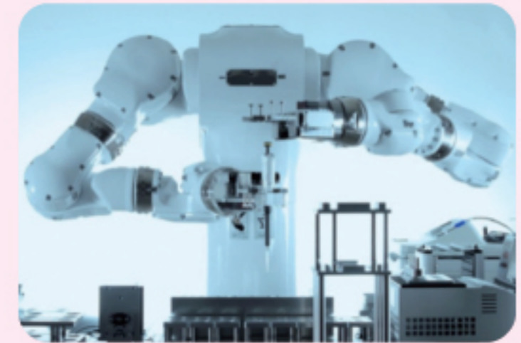
バイオメディカル双腕ロボット【ラポドroid「まほろ」】