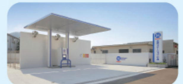
水素ステーション