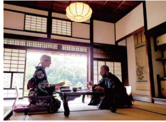
▲外国人観光客の体験風景