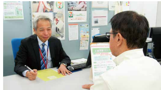
▲70歳現役応援センターの就職相談の様子