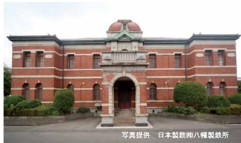
▲官宮八幡製鐵所 日本事務所