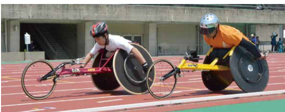
▲福岡県障がい者スポーツ大会