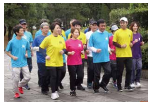
▲スロージョギングの様子