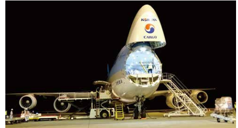
▲大韓航空の貨物専用機 (北九州空港)