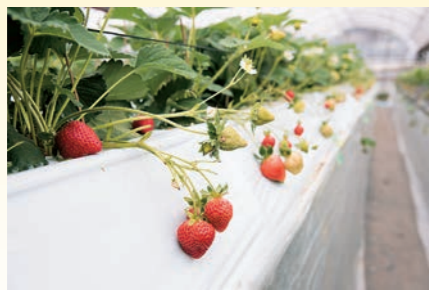
■ イチゴ狩り体験 フルーツのまち・広川でイチゴは一番人気の特産物。「里の駅 広川くだもの村」では1月から4月まで、「あまおう」をはじめ、5種類のイチゴ狩りが楽しめる