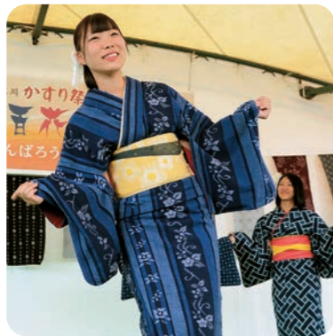
毎年9月に開催される「広川かすり祭」。特売会やファッションショー、工房巡りなどが楽しめるとあって、全国から久留米餅のファンが訪れ、リピーターも多い