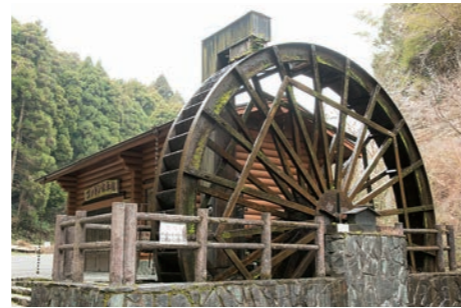
■ 逆瀬ゴットン館 県内最大級の直径7mの水車がシンボル。その動力を使って作られた地元の米やそば粉の販売のほか、手打ちそばも味わえる。秋には「新そば祭り」を開催