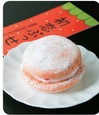
町の特産「あまおう」を生地とクリームに練り込んだ甘酸っぱいスイーツ「初恋ぶっせ」。発売して6年目、1万5千個を売り上げた年も