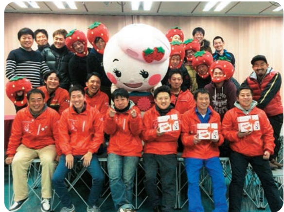
和気あいあいとした雰囲気の中、広川町商工会青年部の皆さんと「広川まち子ちゃん」