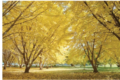
■ 太原のイチョウ 昭和58年の町制施行30周年を記念し、町の木として制定されたシンボルツリー。黄金色に輝く秋の絶景を一目見ようと多くの人が訪れ、話題を集めている