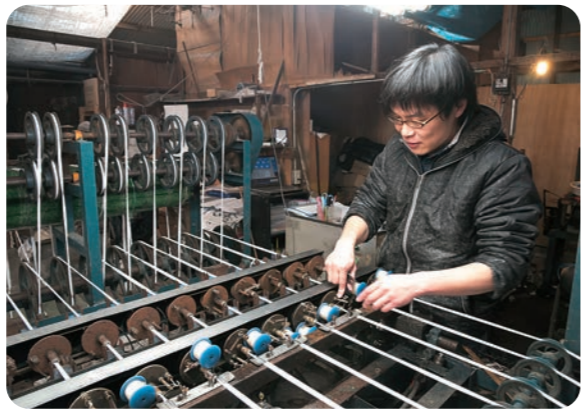
久留米餅の餅の柄を生み出す上で肝となる「くくり」作業。今では紡績会社から仕入れた生糸を白い糸に仕上げている「精練」作業も組合の工場で行っている