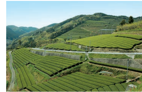
■ 小椎尾地区の段々畑 筑後川の支流、町名の由来ともなった広川の上流にある小椎尾地区。寒暖の差を利用した茶葉の栽培が盛んで、山の谷あいにはのどかな段々畑の風景が広がる