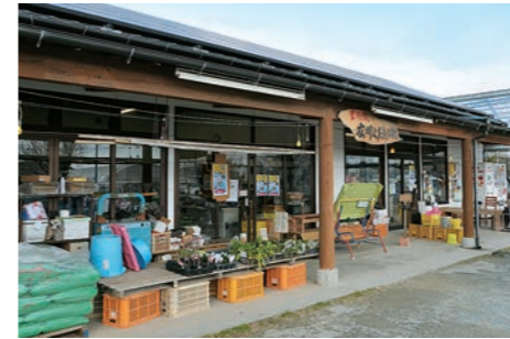
■ 里の駅 広川くだもの村 地域の生産者が育てた、イチゴやブドウなどの町の特産フルーツや農作物を取り扱う直売所。秋にはスローフードフェスタ「秋の収穫祭」が人気