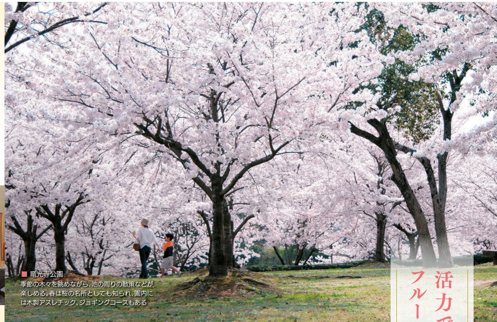
■ 竜光寺公園 季節の木々を眺めながら、池の周りの散策などが楽しめる。春は桜の名所としても知られ、園内には木製アスレチック、ジョギングコースもある