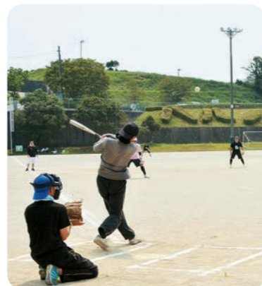
近隣地区の青年部とソフトボールなどのスポーツ大会で親交を深め、地域を盛り上げていく