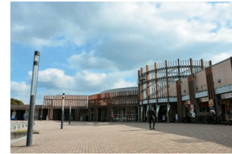
■ 広川サービスエリア インターチェンジに併設されており、高速道路利用者以外も立ち寄ることができる。24時間営業のフードコートや旬のフルーツを販売するコーナーもある