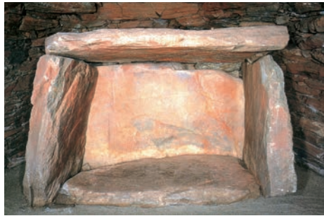
■ 弘化谷古墳 (国指定史跡) 国指定史跡の「石人山古墳」と共に八女古墳群に属し、丘陵を歩いて古墳巡りが楽しめる。隣接する「広川町古墳公園資料館(こふんピア広川)」は入場無料