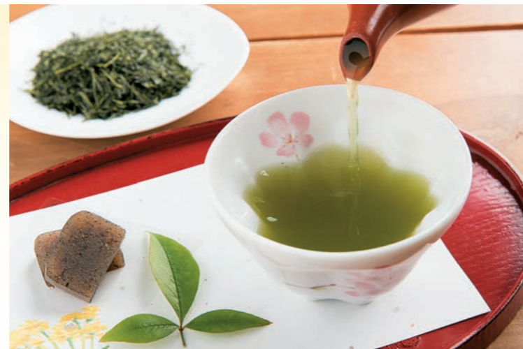
■ 奥八女茶 寒暖差のある山里で栽培される奥八女茶は、色濃く風味がまろやかで格別と評価が高い。製造・販売を営む「茶の葉堂」などでは、振る舞い茶が味わえる