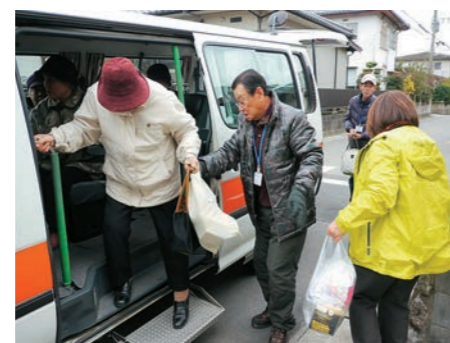
ボランティアによる高齢者への買い物支援

町民が主役のまちづくり 広川町では、地域の課題解決のため、地域に住む一人一人が主役となる地域コミュニティ推進事業を進めています。「地域でできることは地域で」を将来像として掲げ、いつまでもこの地で暮らしたいと思える地域づくりを住民自らの手で進めています。