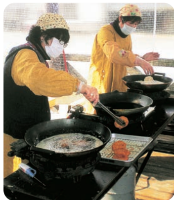
人気のごぼうコロケは、直売所や地域のイベントで販売するたびに、毎回900個ほどが売り切れる