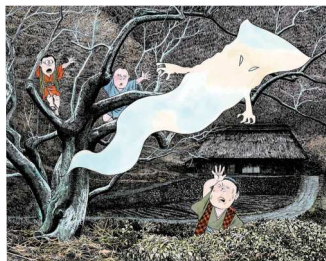
「一反木綿」1991年 ©水木プロダクション 展示期間:10月27日(金)～11月19日(日)

「ゲゲゲの鬼太郎」など数多くのヒット作を生み出し、作品を通して妖怪文化を広めた妖怪研究家としても高く評価された水木しげる。貸本時代からの貴重な漫画や妖怪画の原稿など、卓越した画力とメッセージ性がうかがえる作品やエッセイ原稿、精霊像コレクションなど約390点を展示します。