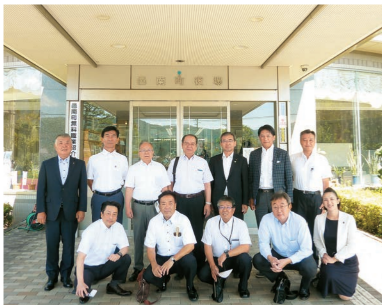
島根県 邑南町役場を視察(平成28年8月23日)

調査特別委員会は、特定の案件を審査したり、調査したりするため、必要に応じて設置されます。本県議会では、現在6つの調査特別委員会が設置されています。今回は次の2つの委員会を紹介いたします。