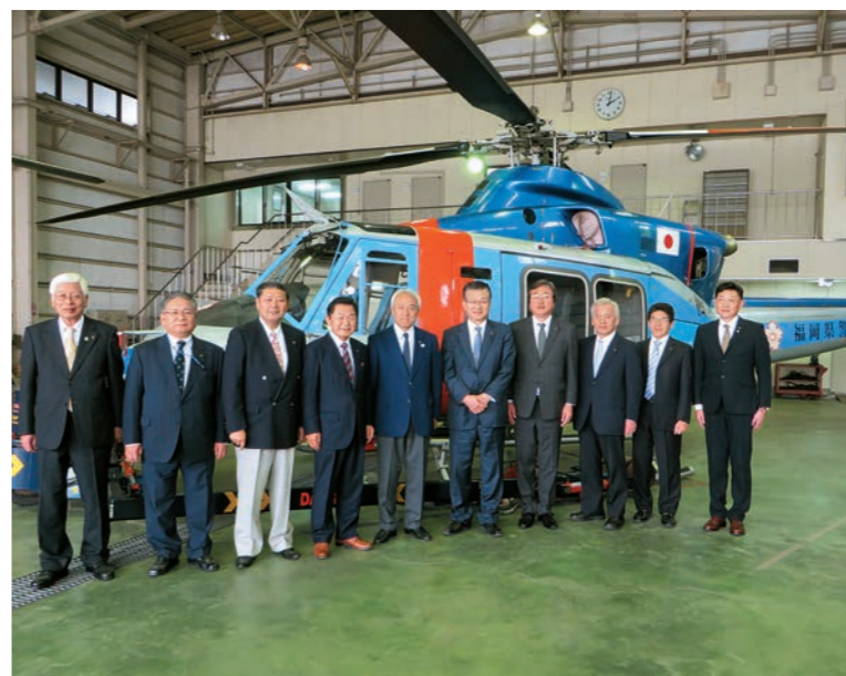
航空隊(福岡市)を視察(平成28年11月8日)

【委員会の開催状況】 11月8日に開催した委員会では、「博多駅前道路における陥没事案の発生について」、「暴力団員の社会復帰対策の現状について」を議題として質疑を行いました。 【視察・調査の状況】 11月8日および9日に、航空隊(福岡市)を視察しました。そのほか、所管にかかる視察・調査を随時行っています。