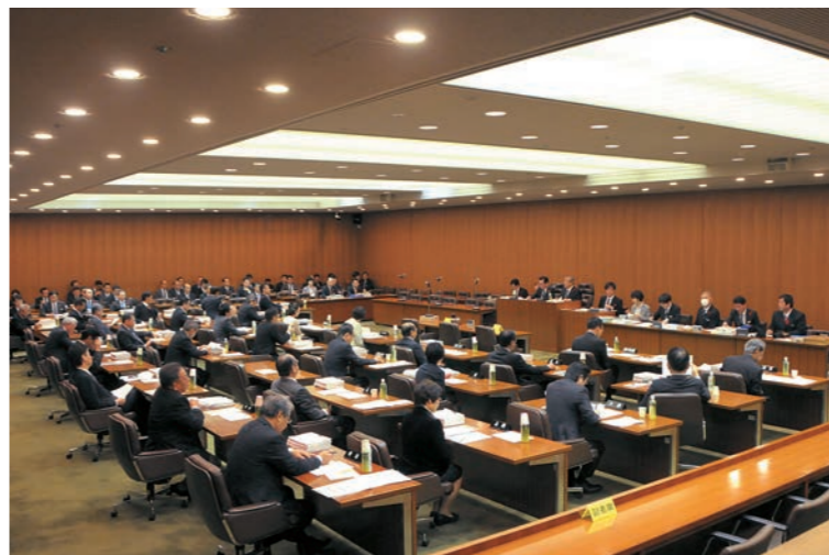
決算特別委員会の審査風景