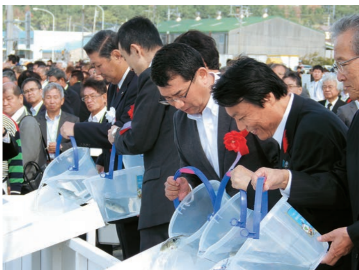
稚魚(トラフグ)の放流

会場では、漁船パレードや魚のつかみ取りなどのイベントが行われ、大勢の参加者でにぎわいました。