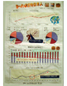
北九州市立折尾西小学校 6年生