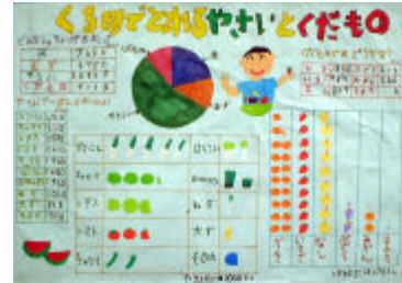
久留米市立京町小学校 2年生