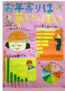
福岡市立三宅小学校 6年生(5名)