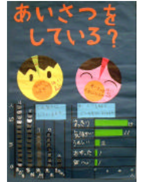
高田町立岩田小学校 4年生